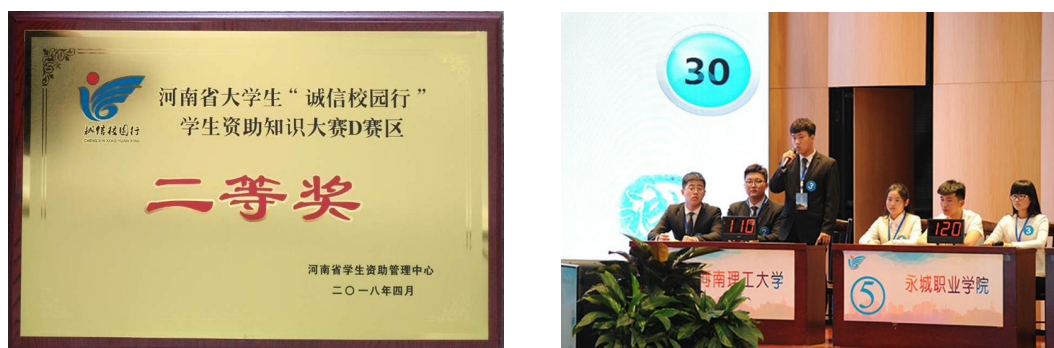
图1 我院学生参加河南省大学生“诚信校园行”学生资助知识大赛