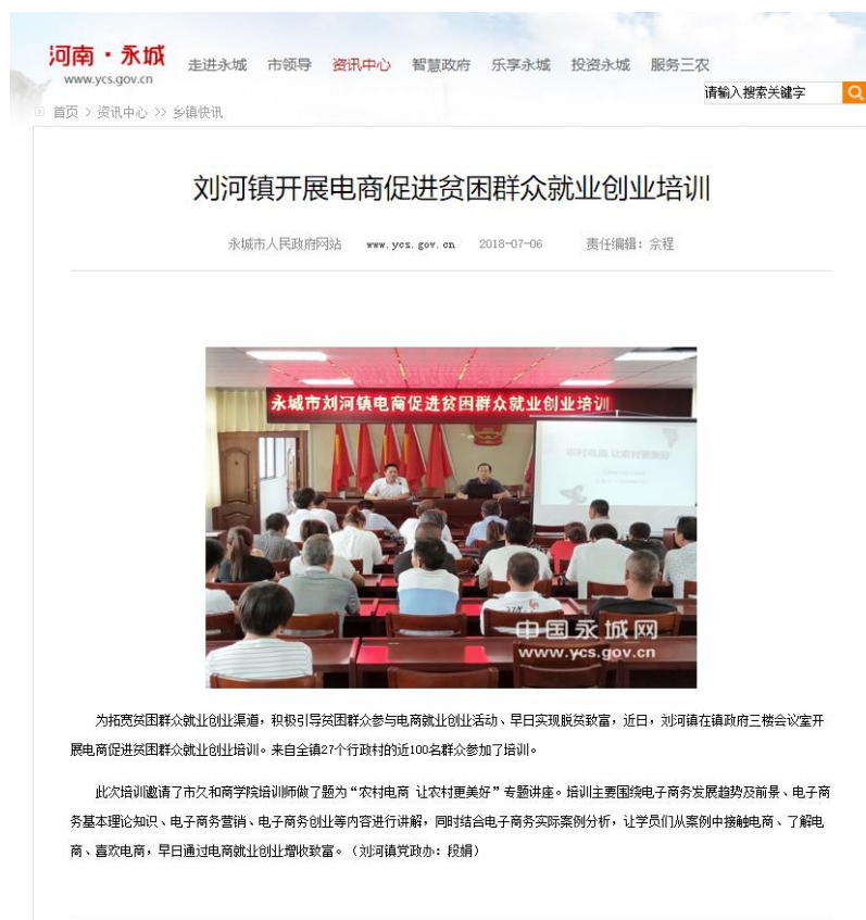
图 7 永城政府网站报道我院电商扶贫培训工作