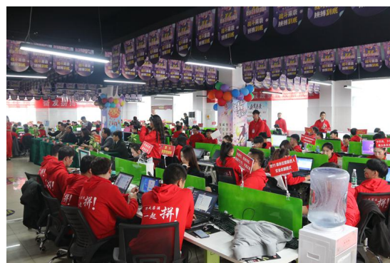
图 6 我院与永易享公司开展校企合作