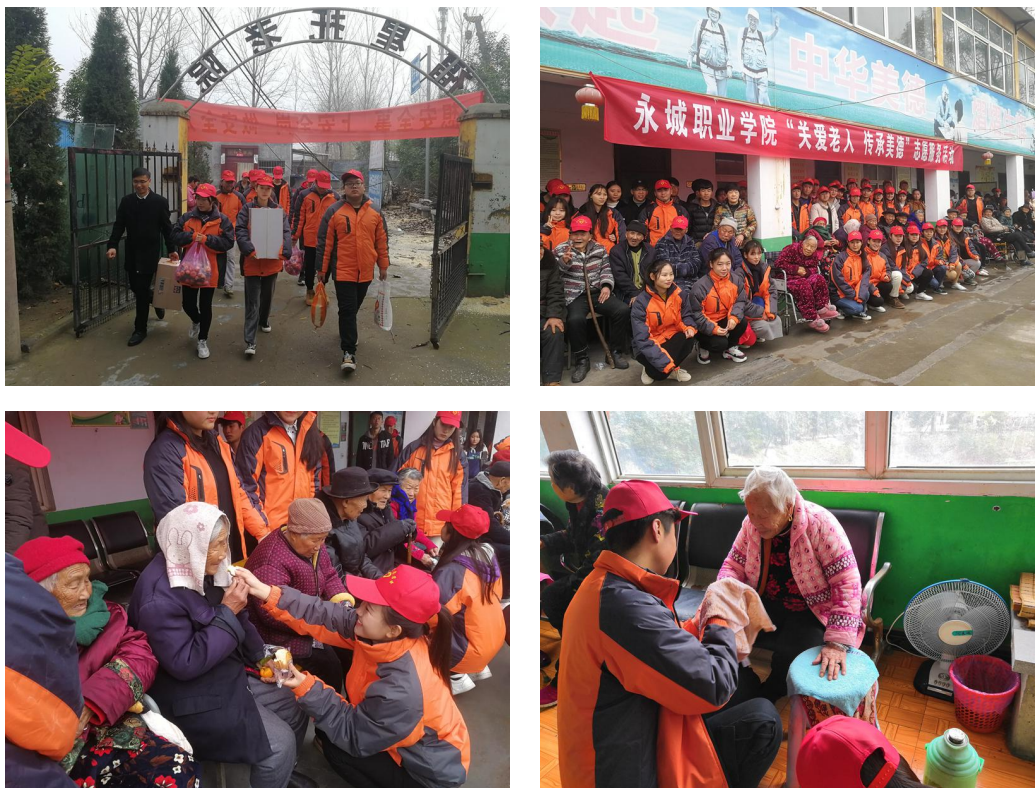
图9 我院志愿者走进敬老院开展敬老爱老活动