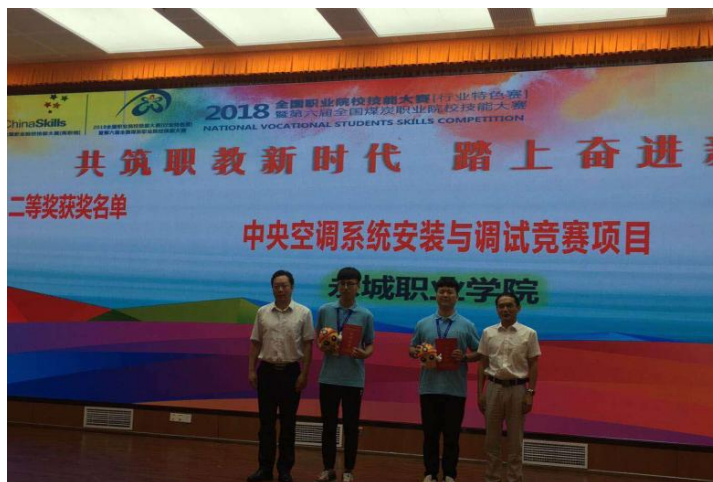
图 4 2018 年全国职业院校技能大赛（行业特色赛）颁奖现场