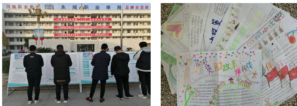
图2 我院组织开展学生资助政策宣传月系列活动

通过本次活动的开展，广泛宣传了学生资助政策和学生资助工作成效，让我院的资助宣传工作更接地气，做到了让资助政策深入人心，实现了让学生、家长及社会各界对各项学生资助政策和资助成效“应知尽知”的目标，解除了经济困难家庭学生学习的后顾之忧，为今后学生资助工作的开展打下了良好的基础。