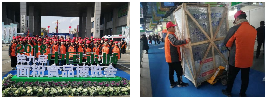
图 8 我院志愿者服务第九届中国·永城面粉食品博览会

为保障展会顺利进行，根据团市委统一安排，学院组织 150 名志愿者全程参与展会服务工作。期间，志愿者们协助各地商客登记、布展，引导市民参观，志愿者们良好的精神面貌和积极的服务态度，受到了参展商和主办单位的一致好评。