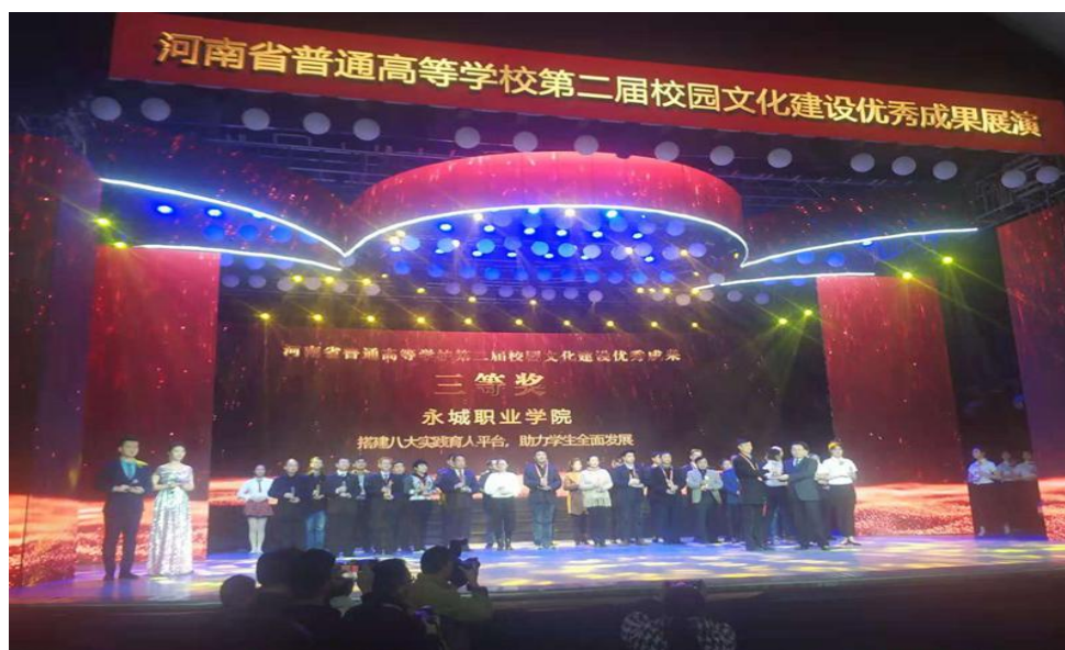
图3 我院实践育人活动荣获河南省第二届高校校园文化建设优秀成果三等奖

通过不懈努力，大学生参与社会实践锻炼的热情不断高涨，参与实践的自觉性不断增强，大学生的综合素质也不断提高。我院大学生社会实践工作也取得了一些成果。《人民网—河南视窗》、《中青网河南频道》、《商丘日报》、《商丘电视台》、《永城电视台》、《今日永城》等新闻媒体多次对学校的大学生社会实践活动进行了相关报道。另外，《搭建八大实践育人平台，助力学生全面发展》实践育人活动荣获河南省第二届高校校园文化建设优秀成果三等奖。